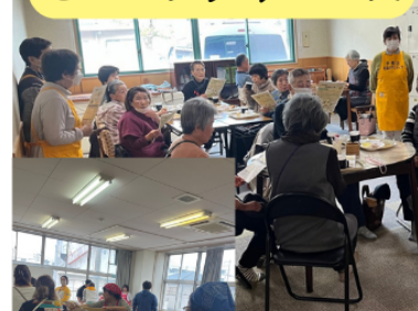
モーニングサービス

幸校区では、令和6年度に毎月第3水曜日に行っているモーニングサービスの活動場所を小栗の湯に変更し、新たに老人クラブの女性メンバーをサロンボランティアとして起用しました。その結果、安定した活動を行うことができ、毎月20人以上の方が参加しています。また、新たに子ども食堂「ほっとステーション」も立ち上がりました。地域内には子ども食堂「てらこやハッピー」などもあり、地域の方が安心して集える居場所づくりが進んでいます。